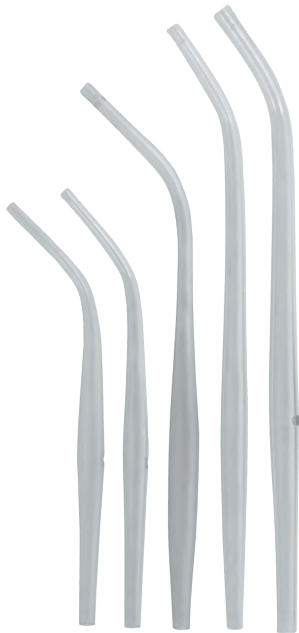
[1] [2] [3] [4] [5]