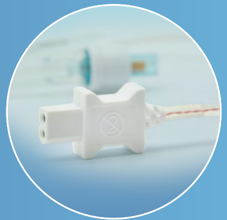
Weißer Konnektor mit ergonomischem Griff für sichere und einfache Handhabung