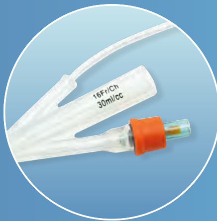
Farbkodierter Schrumpfschlauch zur leichteren Größenidentifizierung