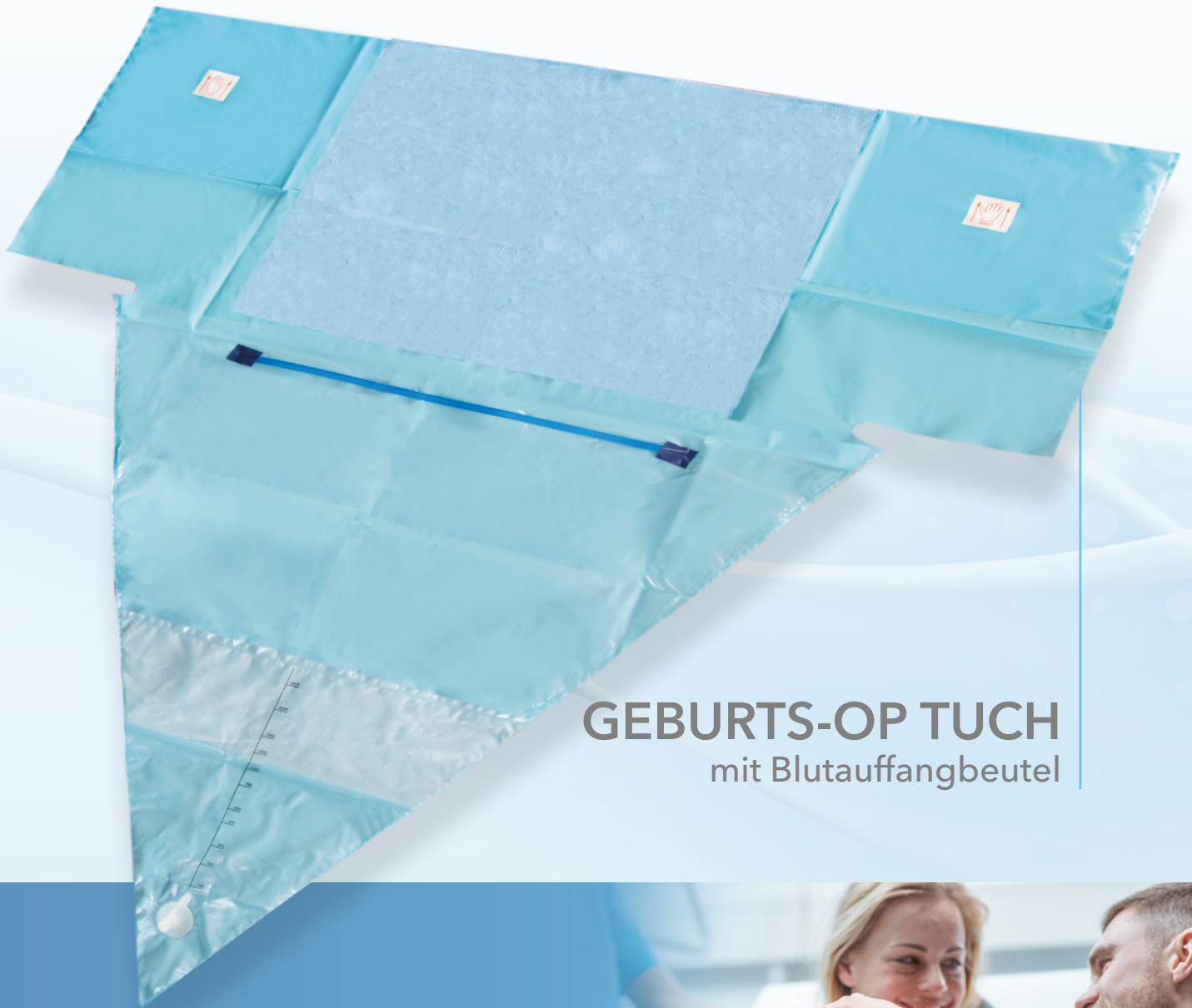
GEBURTS-OP TUCH mit Blutauffangbeutel